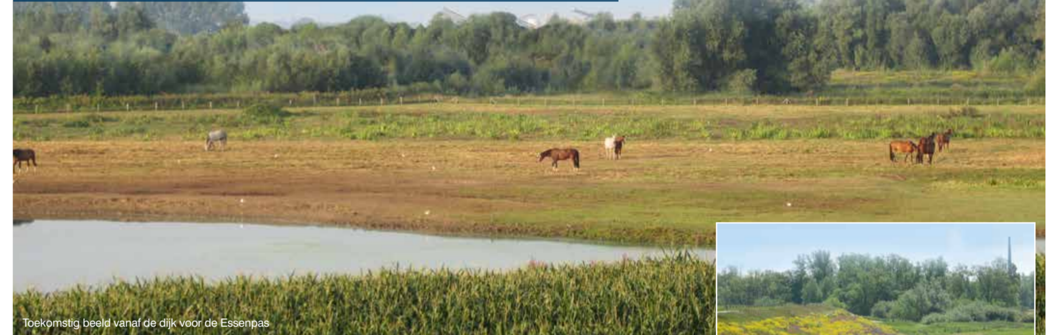
Toekomstig beeld vanaf de dijk voor de Essenpas

De afgelopen jaren zijn er veel wensen vanuit de omgeving ingebracht voor de uiterwaard. Samen hebben wij een inrichtingsplan opgesteld en deze is eind vorig jaar gepresenteerd in de veldschuur van Lingewaard Natuurlijk. Ook daarna hebben er diverse overleggen met onder andere de wijkverenigingen plaatsgevonden en zijn er nog een aantal wijzigingen aangebracht. Vooral de wens om een ruiterroute op te nemen in het plan heeft veel overleg met zich mee gebracht (het Waterschap moest hiermee instemmen in verband met de op- en afritten aan de dijk en met Staatsbosbeheer is er veel overleg gevoerd om de beheersbaarheid te kunnen waarborgen). Wij zijn er trots op dat hier nu overeenstemming over is. Daarnaast zijn