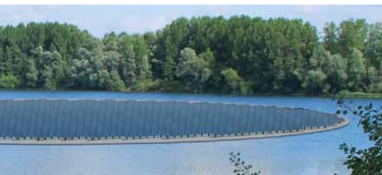
Impressie drijvend zonnepanelenveld

Het plan is gebaseerd op de in 2004 bestuurlijk vastgestelde Visie Havikerpoort en maakt integraal onderdeel uit van een totale gebiedsvisie voor het gehele gebied tussen Veluwezoom en IJssel. In deze nieuwsbrief praten wij u graag bij over de stand van zaken en leest u bijdragen van betrokkenen bij dit project.