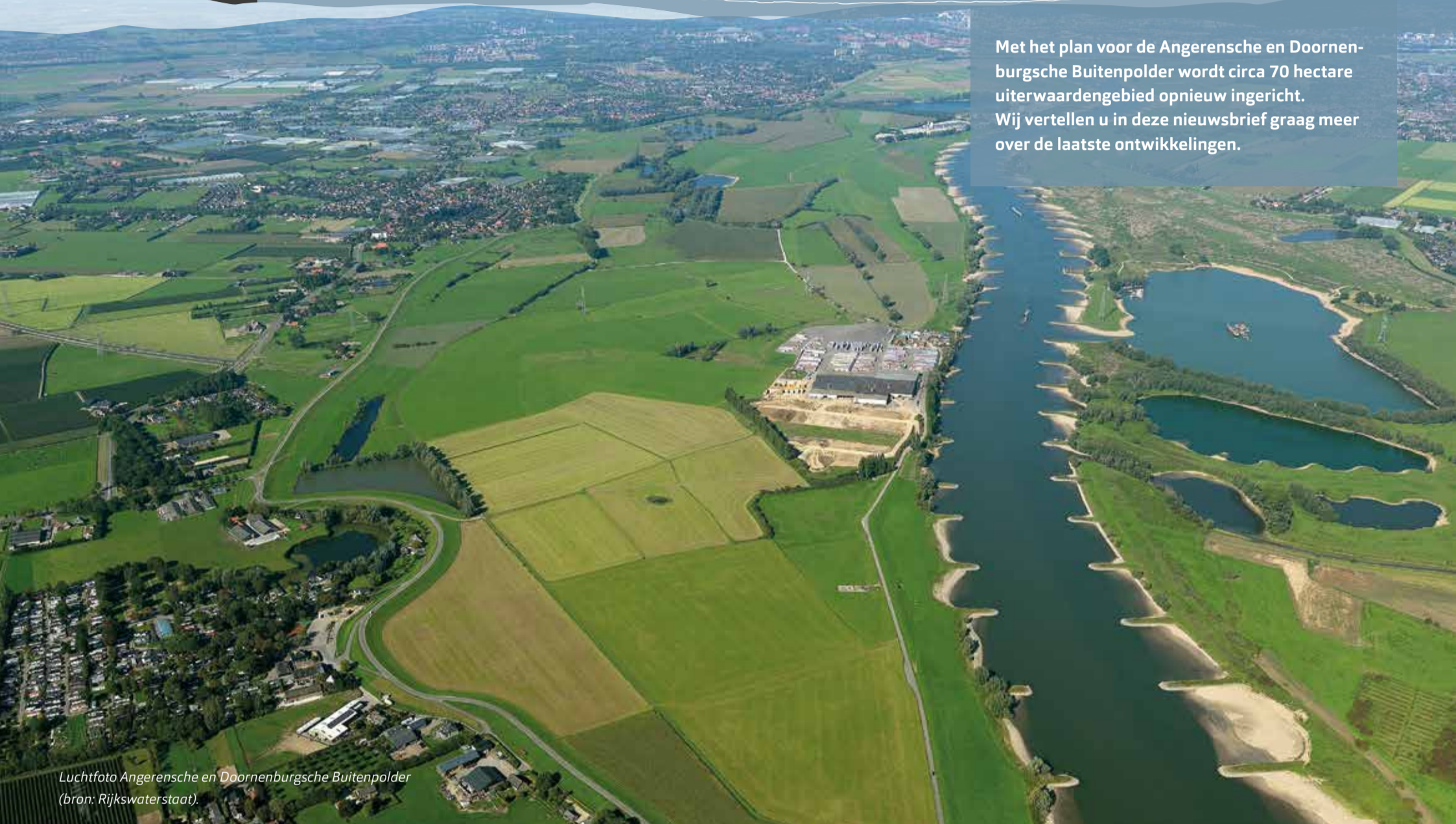
Luchtfoto Angerensche en Doornenburgsche Buitenpolder.

Met het plan voor de Angerensche en Doornenburgsche Buitenpolder wordt circa 70 hectare uiterwaardengebied opnieuw ingericht. Wij vertellen u in deze nieuwsbrief graag meer over de laatste ontwikkelingen.