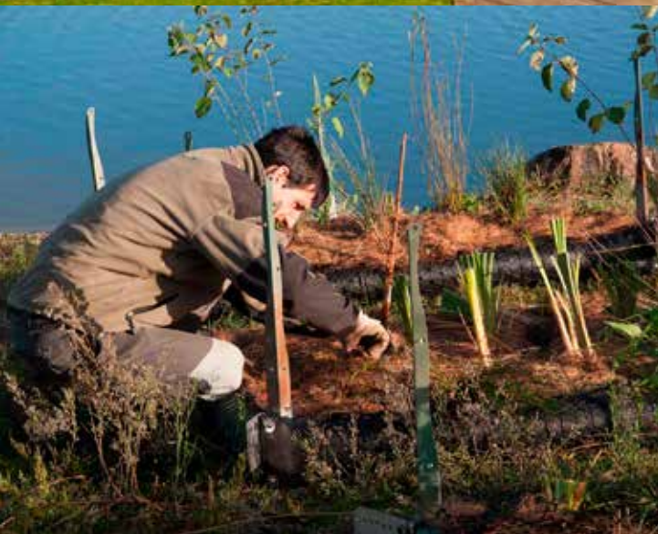
Impressies drijvend groen

We zitten in de Betuwe, dus er is in de omgeving enorm veel kennis over groen, hovenieren en tuinieren. Wij willen u hierbij dan ook uitnodigen om met ons mee te denken. Heeft u goede ideeën voor de tuinen of kent u een partij die volgens u erg geschikt is om mee samen te werken? Laat het ons weten!