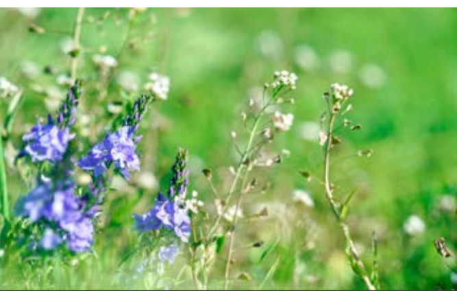
Biodiversiteit: belangrijk voor natuur én landbouw