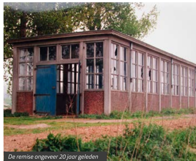
De remise ongeveer 20 jaar geleden

“Precies. Die kan het verhaal vertellen van de Rhedense baksteenindustrie. En daar zijn zoveel mooie verhalen over te vertellen. In Rheden was bijna iedereen hervormd, maar er was ook een Roomse gemeenschap. En de steenfabrieken waren ook van Roomse families die ook weer Roomse arbeiders in dienst namen. Daar ontstond toen een Roomse gemeenschap. Dat wist ik als kind en dat wilde ik graag ontrafelen. Die mensen