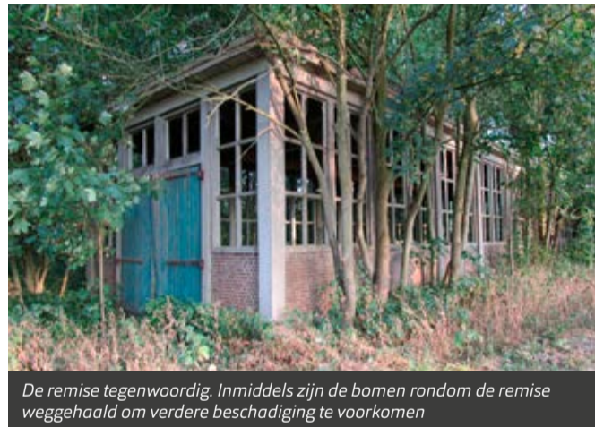
De remise tegenwoordig. Inmiddels zijn de bomen rondom de remise weggehaald om verdere beschadiging te voorkomen

“Ik weet nog dat ik als kind met m'n vader door het gebied liep en de hekken opendeed zodat m'n vader het gras kon maaien. Dan zat ik vervolgens in het gras te wachten tot m'n vader klaar was. En daar reden van die kleitreintjes die de gewonnen klei naar de fabriek reden. In m'n herinnering zei iemand toen tegen me: 'Wil je meerijden?' Toen ben ik opgestapt en naar de