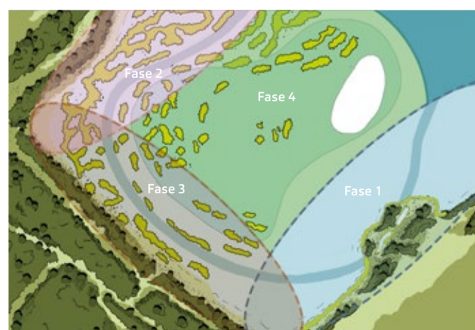
De oorspronkelijke fasering

Bij de wijziging van het inrichtingsplan willen we ook de fasering van het werk aanpassen. De oorspronkelijke fasering gaat uit van vier fases waarin we vanuit verschillende hoeken zouden toepassen, zoals te zien in het kaartje hieronder.