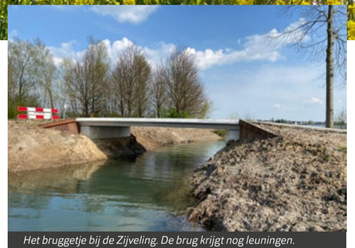
Het bruggetje bij de Zijveling. De brug krijgt nog leuningen.

Ook hebben we de afgelopen maanden graafwerkzaamheden uitgevoerd om meer natuurvriendelijke oevers te realiseren. De bestaande watergang die langs de Zijveling loopt, had geen functie meer. We hebben deze watergang vergraven en een wat natuurlijker aanblik gegeven. Zo zijn er flauwe oeverzones