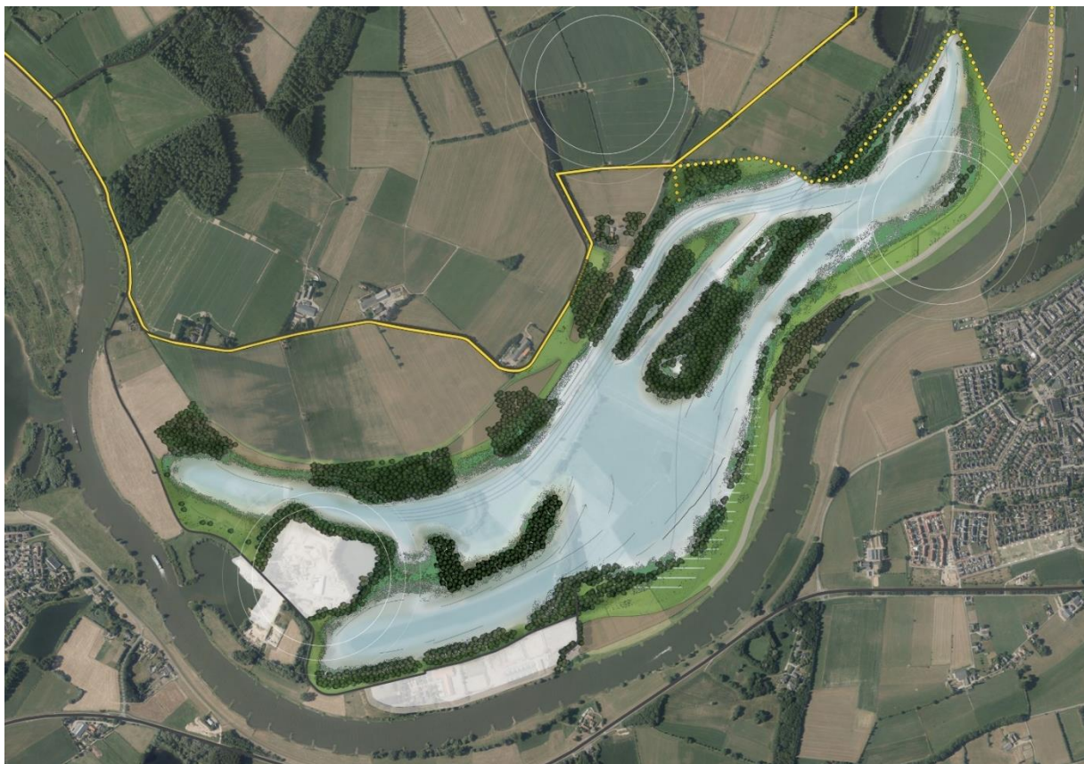
Water- en weidevogelvariant

Bij deze variant wordt maximaal ingezet op de inrichting voor water- en weidevogels. Hierbij wordt met name voor de zone tussen de nieuwe geul en de IJssel gezocht (in het plaatje hierboven aangegeven door middel van de cirkel) naar een optimale balans tussen natuur-inclusief boeren en het realiseren van weidevogelleefgebied. Door deze zone na zandwinning verlaagd op te leveren, ontstaan naar verwachting vochtige, bloemrijke graslanden. Door de nattere omstandigheden ontstaat een betere voedselsituatie voor (jonge) weidevogels. Deze zone wordt tevens vrijgehouden van houtige begroeiing.