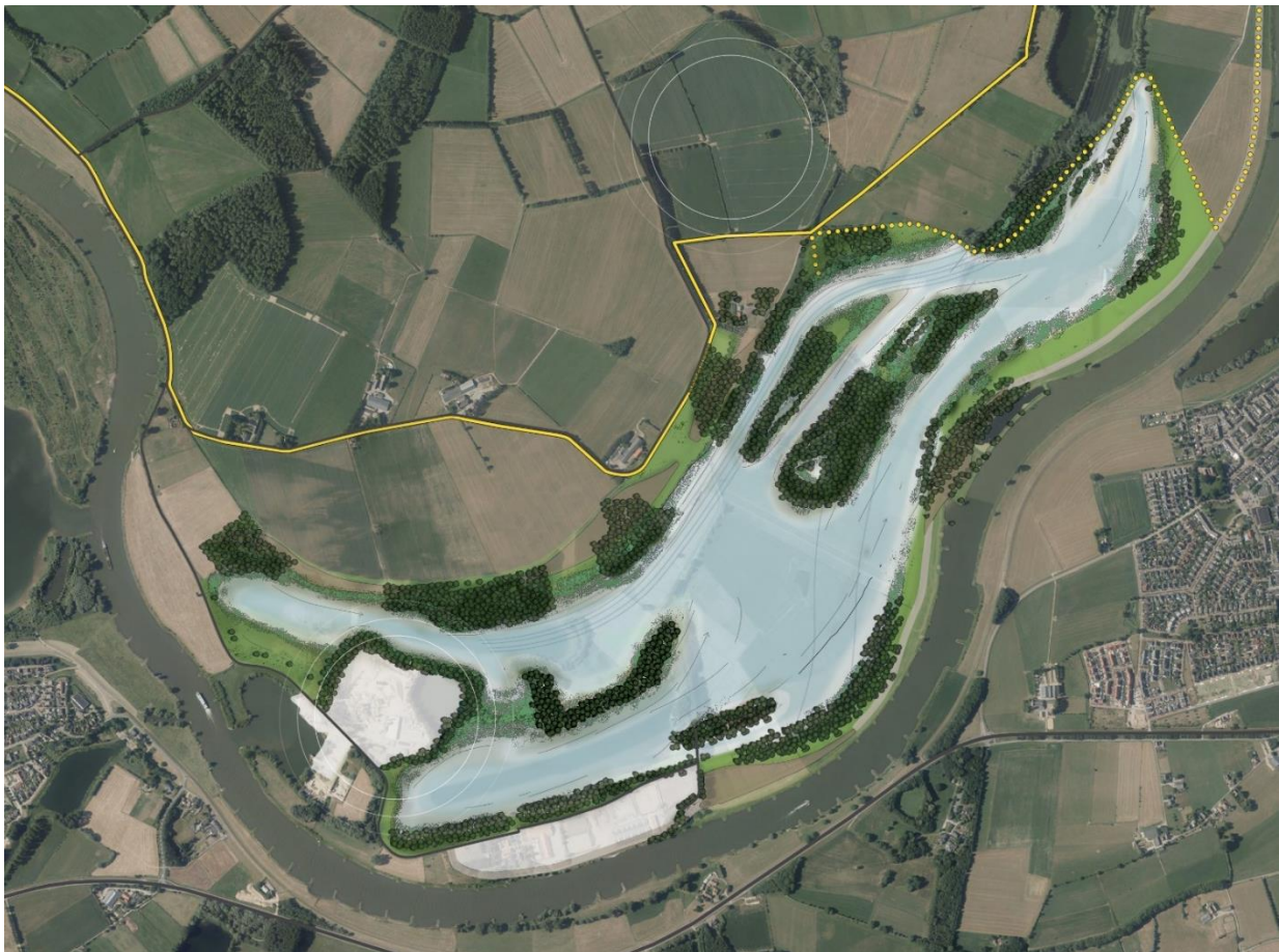
Variant waterberging en buffering

Bij deze variant wordt maximaal ingezet op waterberging en buffering. Hierbij worden de randen opgezocht qua ruimte die ingezet kunnen worden binnen het gebied.