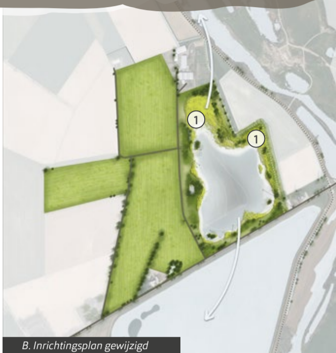
B. Inrichtingsplan gewijzigd