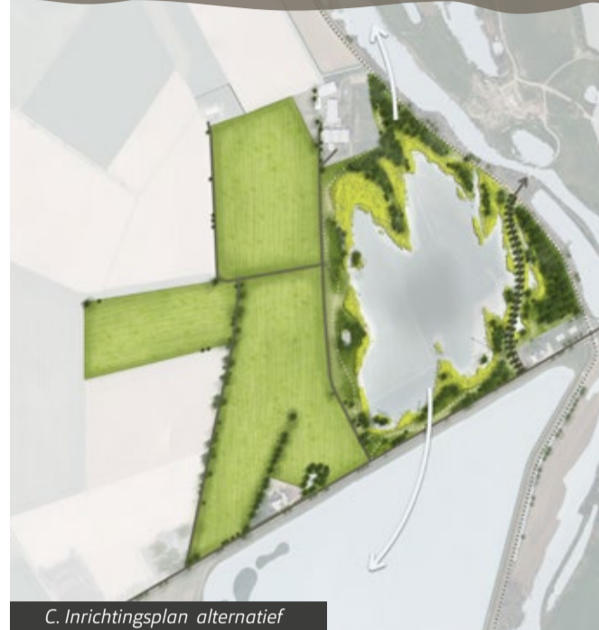
C. Inrichtingsplan alternatief