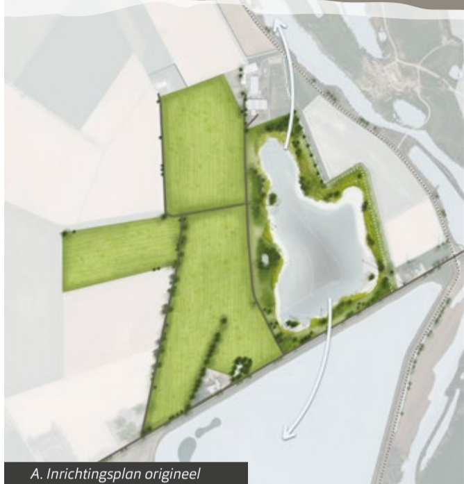
A. Inrichtingsplan origineel