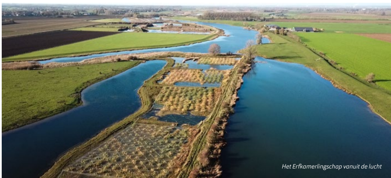
Het Erfkamerlingschap vanuit de lucht

De NRD ligt nog t/m 29 november ter inzage. Daarna gaan we het milieueffectrapport (m.e.r.) opstellen. Een m.e.r. brengt de verwachte milieueffecten van het plan in beeld. Zo kan de overheid deze meenemen bij haar besluit over het plan. In het m.e.r. nemen we onder andere de onderzoeken mee die we in de NRD hebben aangegeven te gaan uitvoeren en die we ook eerder in deze nieuwsbrief al noemden. We verwachten het komende halfjaar bezig te zijn met dit m.e.r.