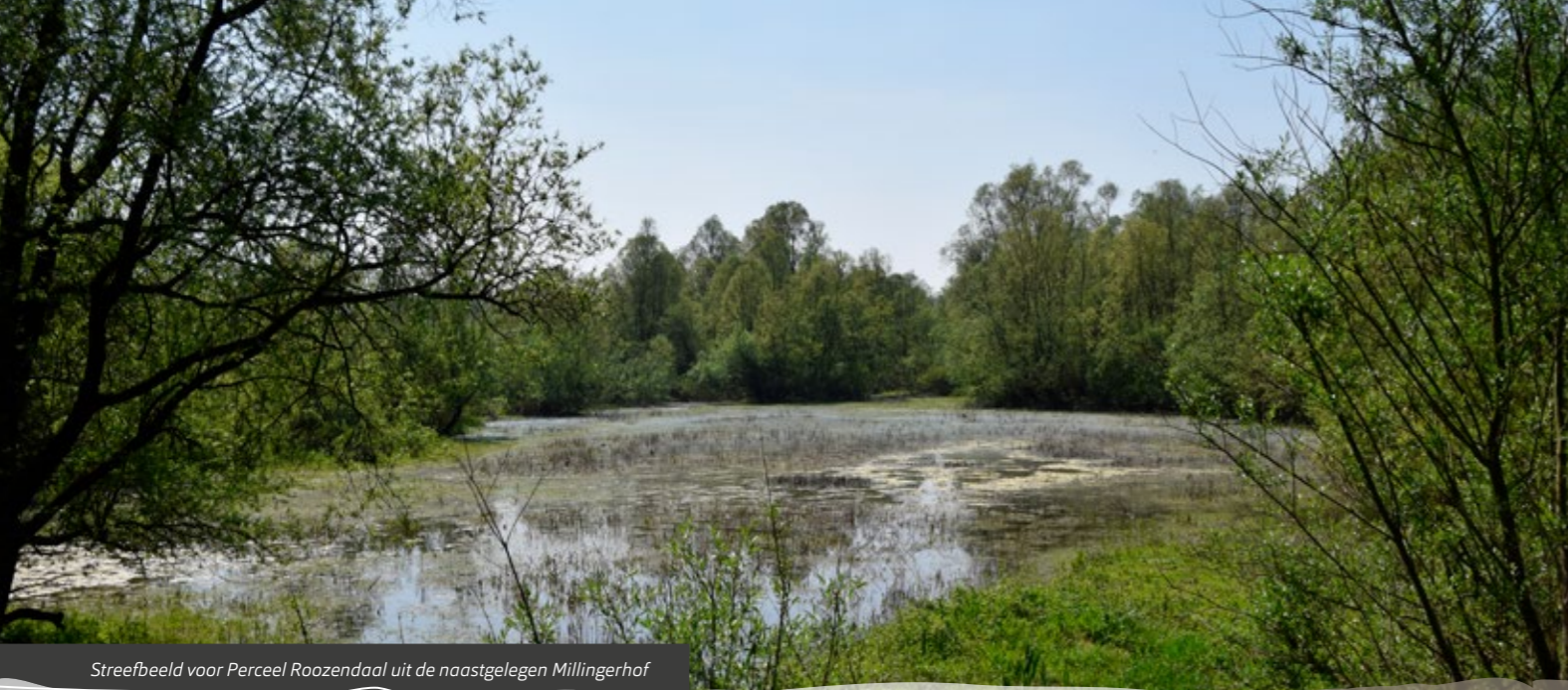
Streefbeeld voor Perceel Roozendaal uit de naastgelegen Millingerhof