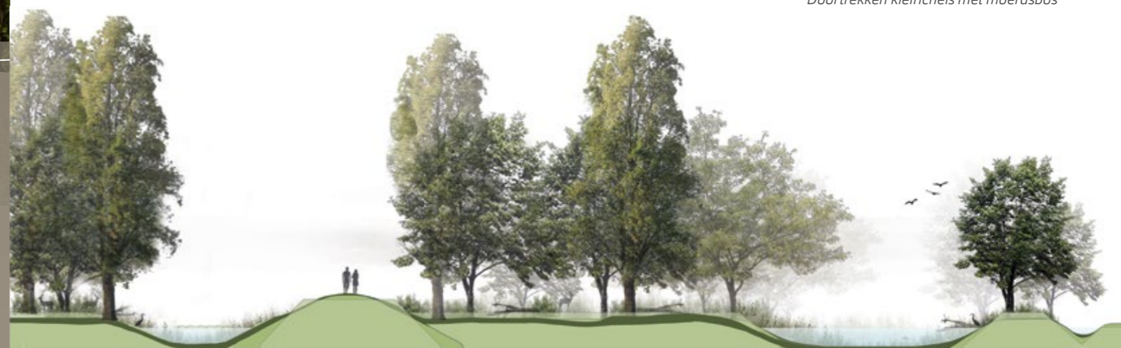
Dwarsprofiel Doortrekken kleirichels met moerasbos

Staatsbosbeheer wil graag dat de rivier weer meer invloed krijgt op dit perceel, waardoor de riviernatuur zich er kan ontwikkelen. Om de rivier meer invloed te laten krijgen op het gebied, moet het perceel wat worden verlaagd. Dat kan door de klei reliëfvolgend af te graven.