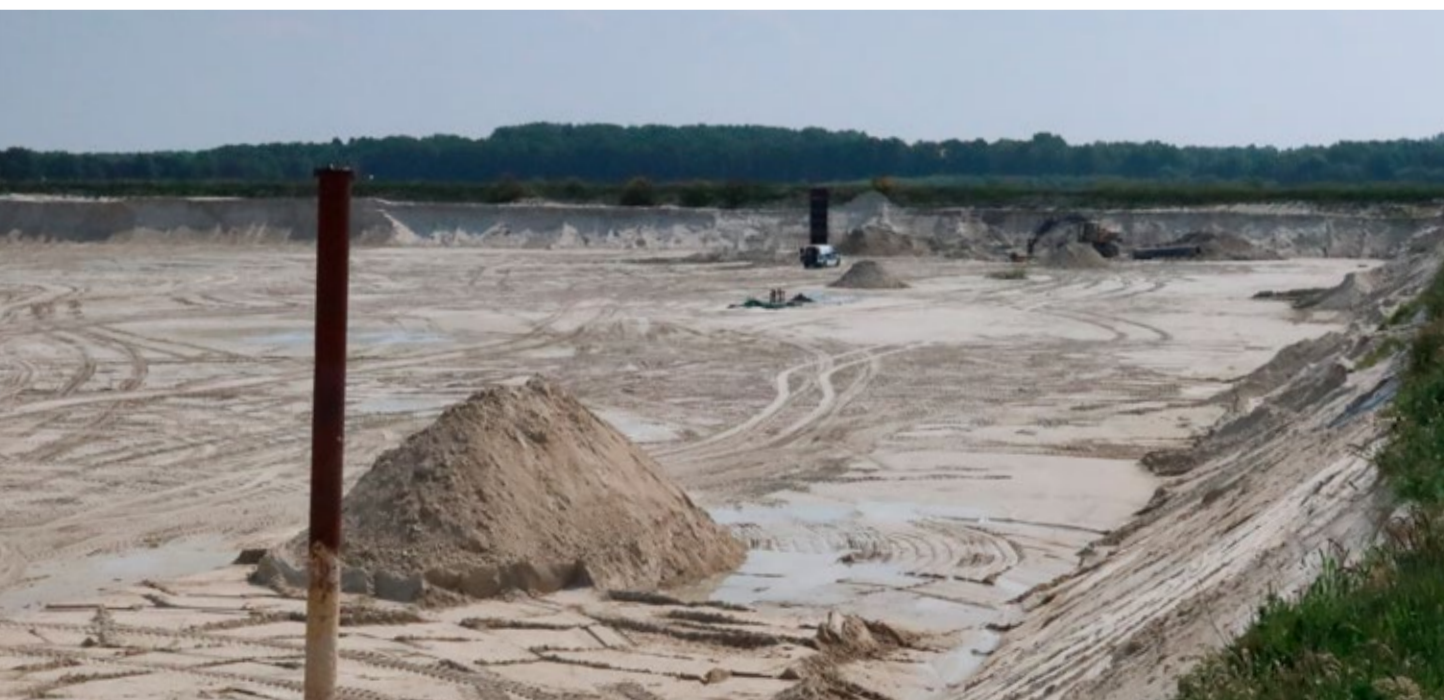
Het depot was zo goed als leeg

Heeft u nog vragen over het (vergunningen)traject, dan kunt u uiteraard contact met ons opnemen. Onze contactgegevens vindt u op de achterzijde van deze nieuwsbrief. Ook is het in overleg altijd mogelijk om ter plekke een rondleiding te krijgen.