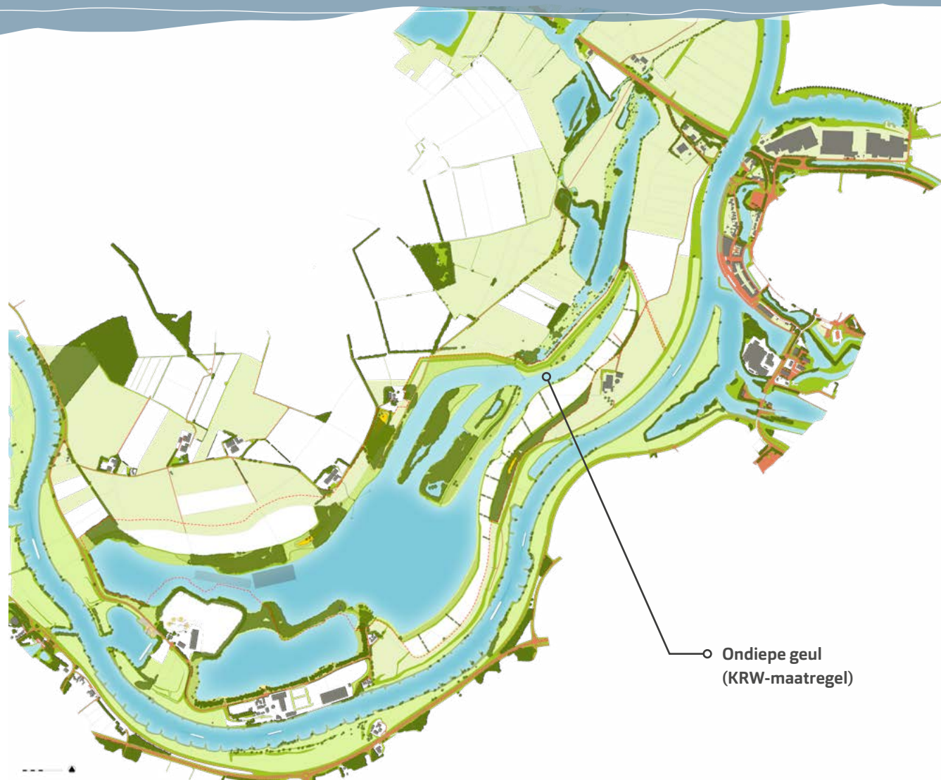
Ondiepe geul (KRW-maatregel)