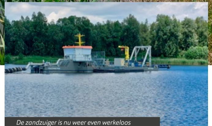
De zandzuiger is nu weer even werkeloos

In de vorige nieuwsbrief meldden we dat we dit voorjaar in overleg met de Natuurfederatie Geertruidenberg een tijdelijke oeverzwaluwwand wilden aanleggen van grond/zand. Dat was een wens van de Natuurfederatie. Die wand hebben we inmiddels aangelegd en ligt aan de noordwestkant (nummer 9 op het kaartje op de achterzijde van deze nieuwsbrief).