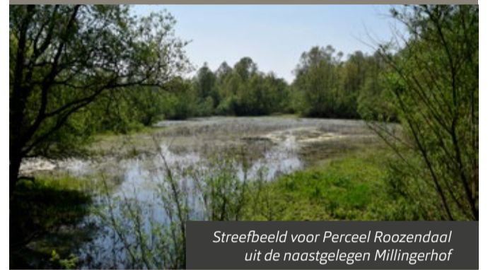
Streefbeeld voor Perceel Roozendaal uit de naastgelegen Millingerhof

Op dit moment bestaat het perceel nog uit grasland. Staatsbosbeheer heeft de wens om het perceel aan te laten sluiten op de aangrenzende riviernatuur. Dat willen we doen door het perceel wat te verlagen, waardoor hoog- en laagwater op de rivier meer invloed krijgen in het gebied. Zo kan de riviernatuur zich optimaal ontwikkelen. De zandige bodem, die door